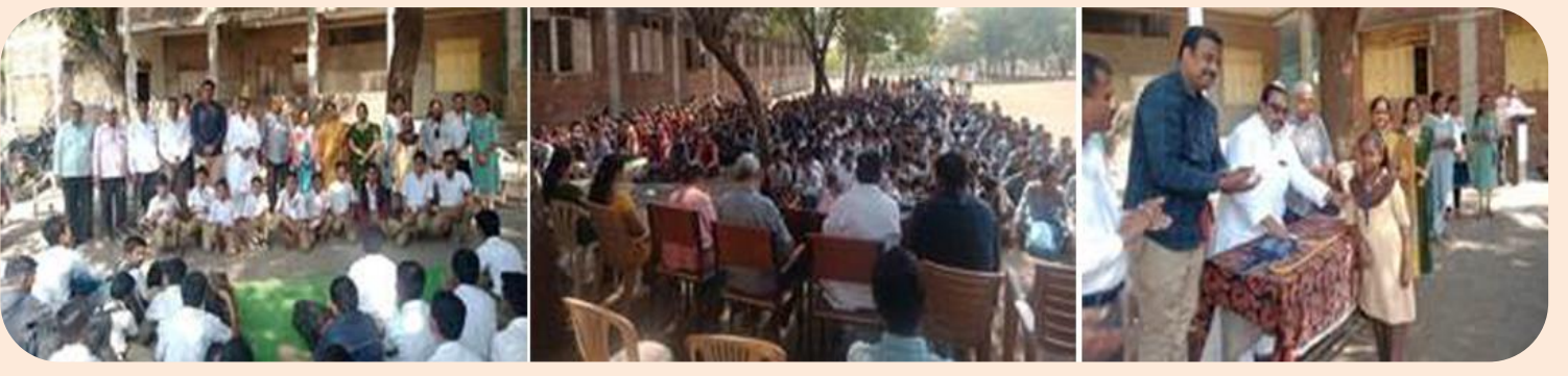
मान्यवरांच्या हस्ते चष्मा वाटप करतांना