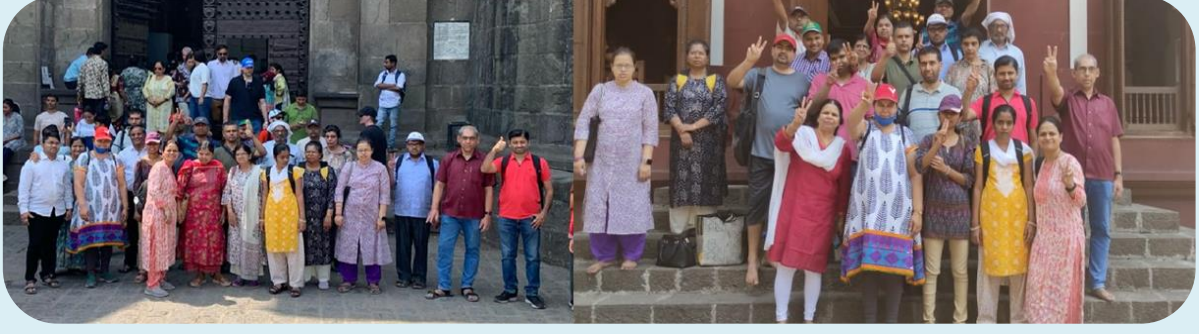
सहलीत सहभागी शुभार्थी

२३ मार्च रोजी ‘सा’ शुभार्थीची एकदिवसीय सहल पुण्यातील ऐतिहासिक स्थळांवर आयोजित करण्यात आली होती शनिवार वाडा, लाल महाल, राजा दिनकर केळकर संग्रहालय इत्यादी स्थळांना भेट देण्यात आल्या.