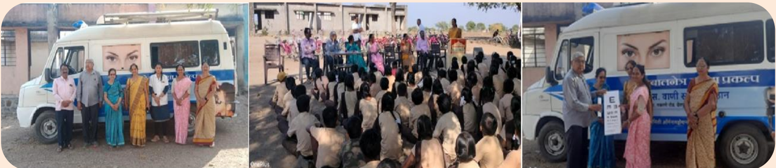
महात्मा ज्योतिबा फुले माध्यमिक हायस्कूल चे मान्यवर व विद्यार्थी