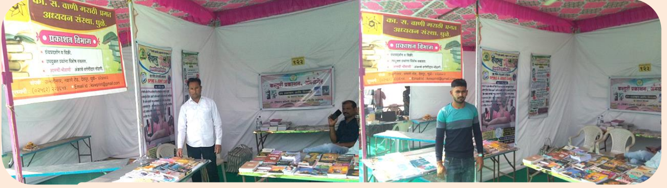
अमळनेर येथे ग्रंथविक्री व प्रदर्शन