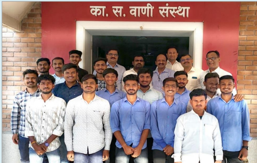
कॅम्पस इंटरव्यूमध्ये सहभागी झालेले संस्थेचे विद्यार्थी