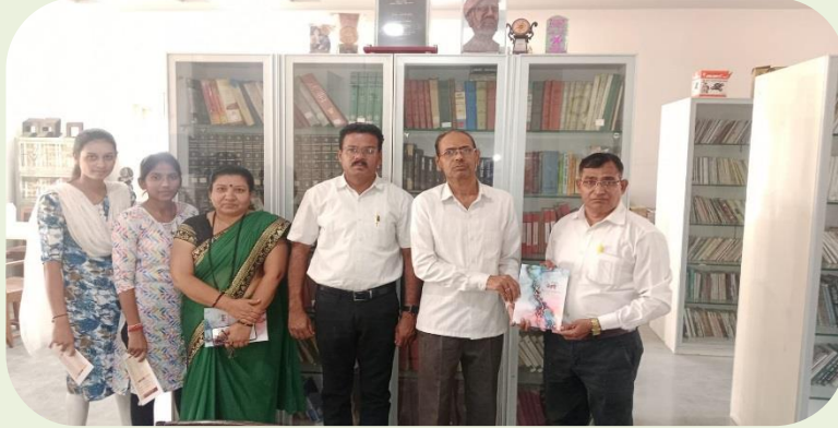
शैक्षणिक भेट, धुळे- जळगाव जिल्ह्यातील विविध महाविद्यालयातील विद्यार्थी.